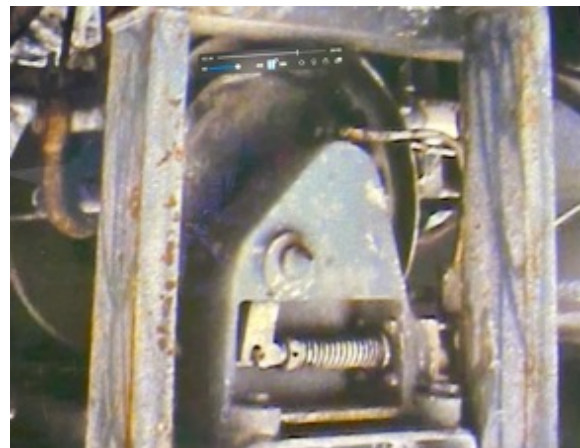
Fotografiene viser en eldre modell, men tilsvarende type OSI dykkelokke og vinsj som ble benyttet ved det ulykksalige dykket på Drill Master